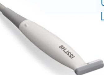
Ultra-Wideband Hockeystick i22LH8