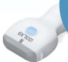
33 MHz Ultra-High Frequency iDMS Linear (i33LX9)