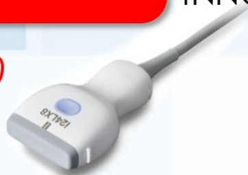
Ultra-Wideband Linear i24LX8